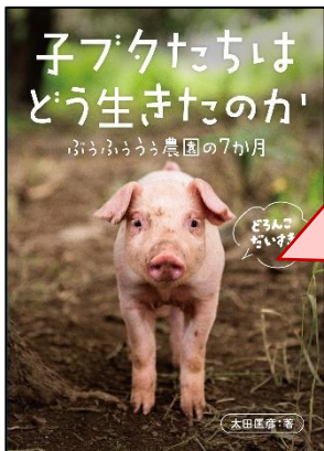
太田国彦著『子ブタたちはどう生きたのか』岩崎書店

動物たちは自分の運命を知らない。それなら生きてい期間、世界一幸せに暮らせるようにしてあげたい。完全放牧の養豚場で生まれた15匹の子豚が出荷されるまでを追いながら、アニマルウェルフェアについて考える本です。子ども向けで写真も多く、読みやすいですが、色々考えさせられます。