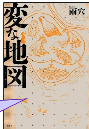
雨穴著『変な地図』双葉社

『変な家』『変な絵』に続く最新作。亡くなった祖母が残した一枚の地図。不思議な地図の謎を追う青年・栗原は、とある集落の暗い過去と殺人事件に関わることに…。