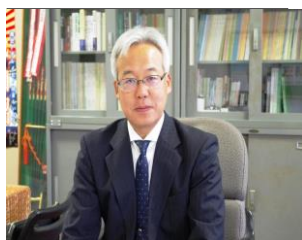
埼玉県立熊谷農業高等学校長